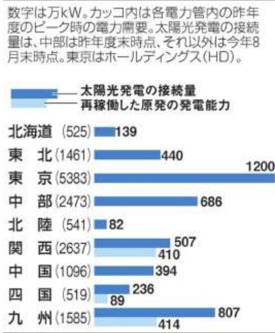
図2. 太陽光発電での接続量と再稼働した原発の発電能力 2

現在は、接続の可否を各電力会社が決めているので再生エネルギー事業者は供給を抑制されている。民主党政権時代のFITを導入した再生エネルギー育成政策や、本年政府が改訂した第5次エネルギー基本計画の「再生エネルギーの主力電源化」の方針に忠実ならば、太陽光を含めた再生エネルギーの普及はさらに進んでいたはずである。そして、再生エネルギーを優先するためには、原発1基を止めるべきである 3 。