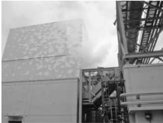
Fig. 3 Steam coming out of a blow-out panel opening at the Fukushima Dai-ichi Unit 2 Reactor Building on March 15, 2011