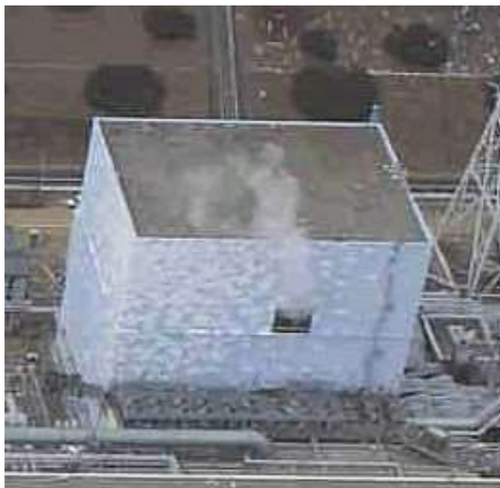
図1. 2号機のブローアウトパネルが自動的に落下して内部の水蒸気が放出されているところ

福島第一原発事故の際に、1号機・3号機・4号機の建屋上部が、内部にたまった水素ガスが着火し爆発したことによって大破した。一方、2号機の建屋内部への水素漏洩蓄積は、炉心メルトダウンの発生度合いに大きな違いが無いことから、他の号機と同様と推測されるが、隣接する3号機の爆風を受けてブローアウトパネルが自動的に落下して、水素を外気へ自動放出する結果になったので、爆発は免れたと理解されている。図1に、2号機のブローアウトパネルが自動的に落下して内部の水蒸気が放出されているところを示す。